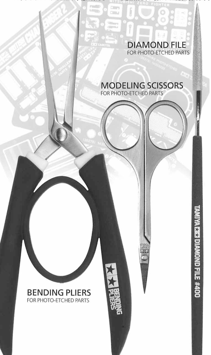
DIAMOND FILE FOR PHOTO-ETCHED PARTS

専用ツールが登場です。どの工具もタミヤの模型製作スタッフがテストを重ねて生み出したタミヤオリジナル。使いやすさと作業効率に優れしかも長く使えます。