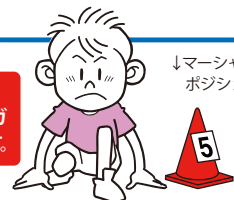
↓マーシャルポジション