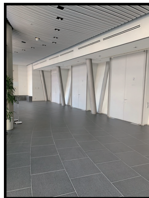
受付場所 (9:00 開始)