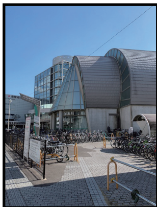
会場入口 (9:00 開場)