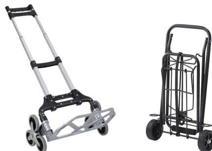
※2輪キャリーカート例