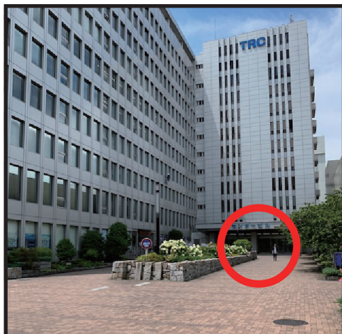
TRC ビル入口 (7:30 開場)