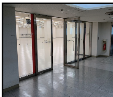
会場入口 (8:00 開場)