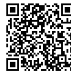
赤レンガ倉庫 アクセス

会場前の道路での機材の積み下ろしは、絶対に行わないでください。道路を通行される方の迷惑や交通事故等の原因となります。