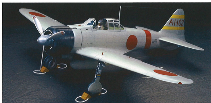
1/32 エアークラフトシリーズ 三菱 海軍零式艦上戦闘機二型