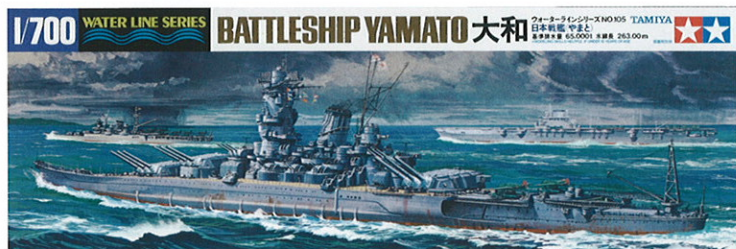
1/700 ウォーターラインシリーズ 日本海軍 戦艦 大和(やまと) 画・上田毅八郎