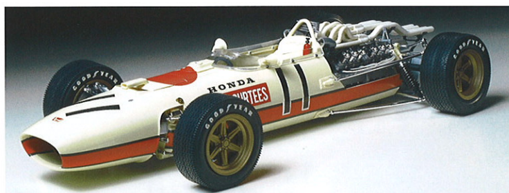
1/12 ビッグスケールシリーズ ホンダF-1 (1967年)

模型に人生を懸けた田宮氏の、創業時から今に至るまでの様々な試練やそこに生まれたいくつかの人間ドラマを作品とともに紹介します。模型ファンに限らず幅広い世代の方に田宮芸術の神髄を楽しんで頂きます。