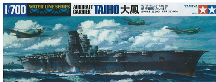
1/700 ウォーターラインシリーズ 日本航空母艦 大鳳(たいほう) 画・上田毅八郎